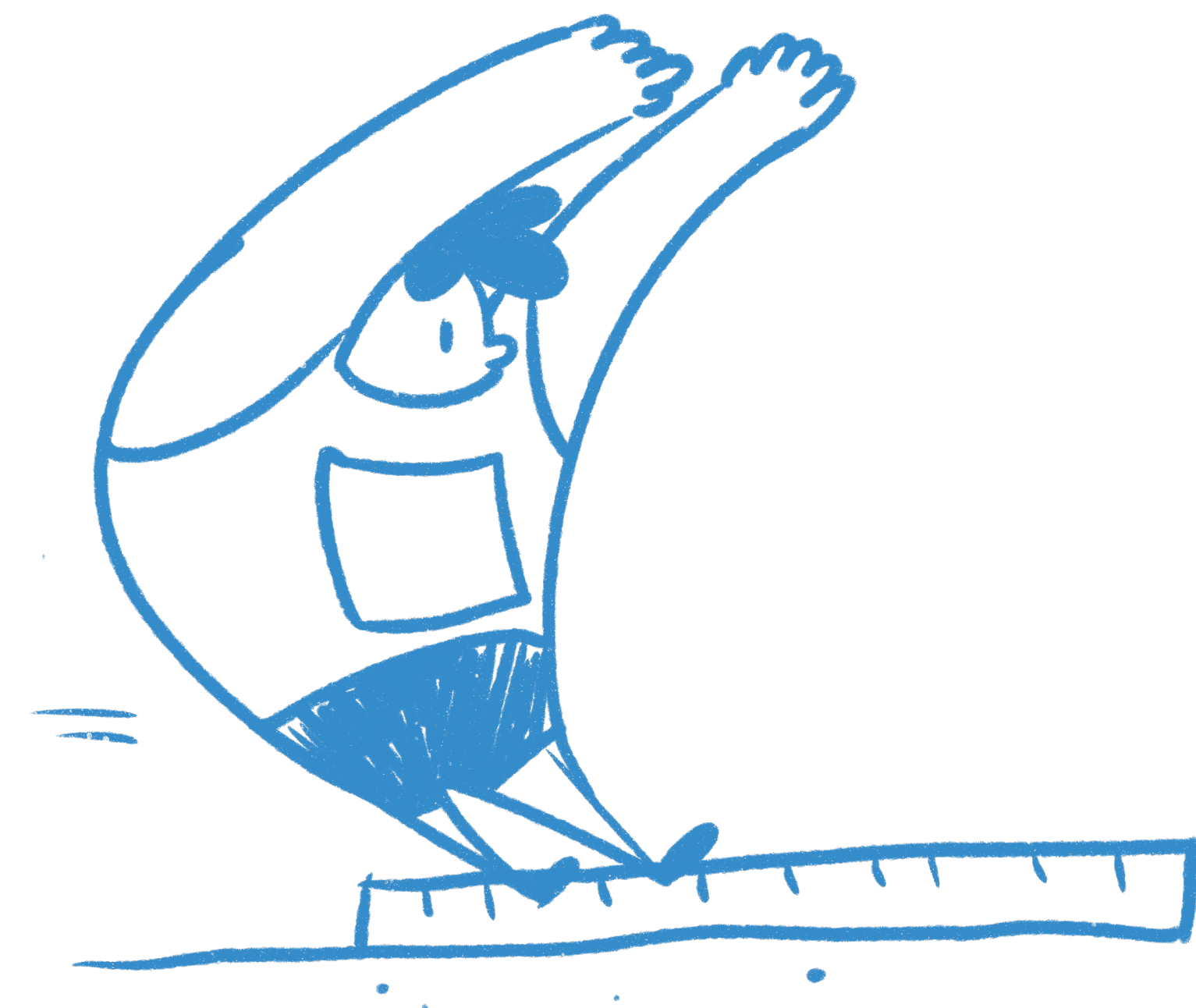
Miesten pituusfinaali - Helsinki 2005